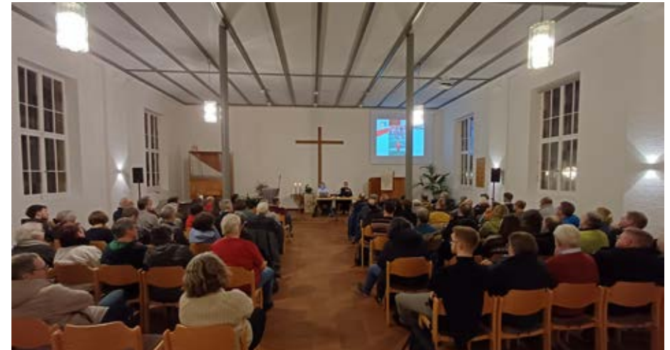
Volle Konzentration bei der gemeinsamen Bezirkskonferenz am 28. Februar.

Der neue Bezirk wird sich ab 17. Juni aus den sechs Gemeinden Esslingen (mit den Standorten Berkheim, Esslingen-Innenstadt und Hegensberg), Göppingen, Kirchheim u. T. (mit Standorten in Kirchheim und Schlierbach), Nellingen, Plochingen und Weilheim a. d. T. (mit dem Café Wesley's Weilheim) zusammensetzen. Auch deren künftige Arbeit soll im christlichen Miteinander erfolgen nach den drei Hauptprinzipien Vertrauen – Konsens – Transparenz. Die Gemeinden sind schließlich die Orte des Bezirks Neckar-Voralb,