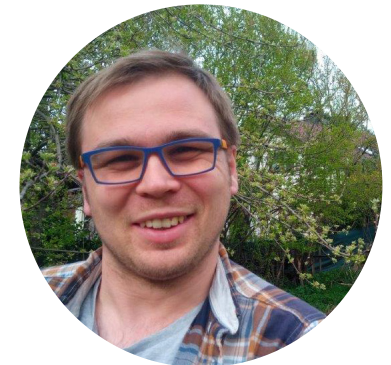
Autor: Peter Kaltschnee

Mir zeigt das: Was von dem aufgeht, was ich aussäe, das weiß ich nicht. Dies liegt in Gottes Hand. Ostern zeigt mir auch: Das Neue muss nicht so aussehen wie das Alte. Es kann ganz überraschend anders sein. Ostern ist Gottes große Überraschung für unsere Welt, sein Neuanfang mit uns. Wir können Gutes aussäen, Boden vorbereiten und gießen. Was davon aufgehen wird, wie es aussehen wird, ist für uns Menschen unvorhersehbar – wir dürfen darauf vertrauen: Es ist in Gottes Hand.