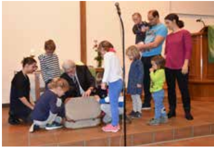
Koffer für Kinder